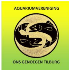
logo recht verscherpt