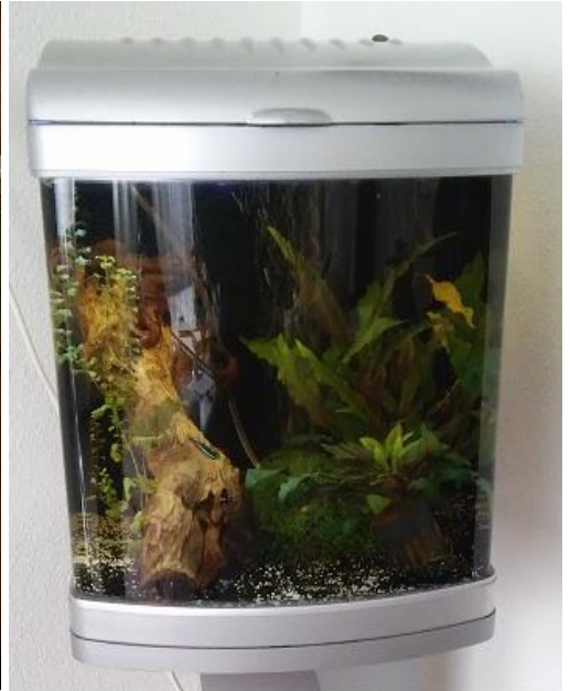
Nieuw bakje t.b.v. Animal Event