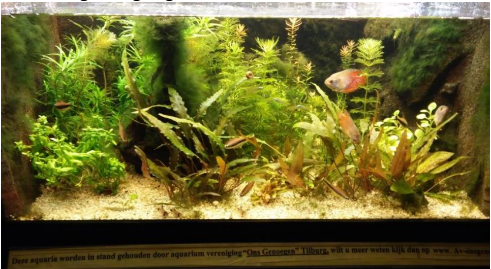
Ons zelfbouw bakje

De dag daarna is er nog een 2 e aangekocht aquarium geplaatst in de Oliemeulen en zijn de vissen beter verdeeld. Tot de volgende gelegenheid.