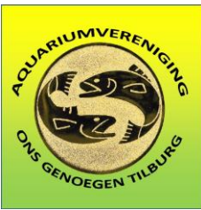
logo rond vaag