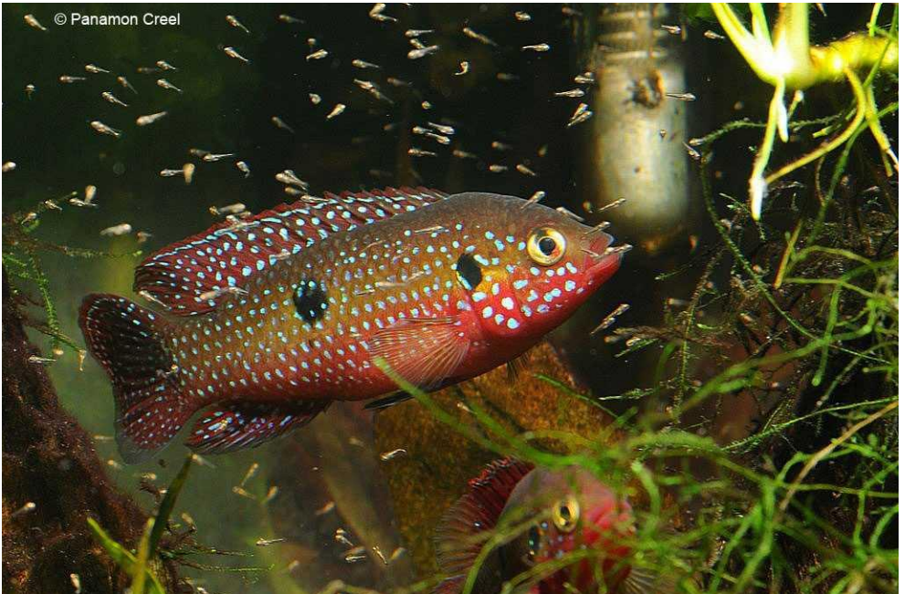
hemichromis-bimaculatus Rode Cichlide