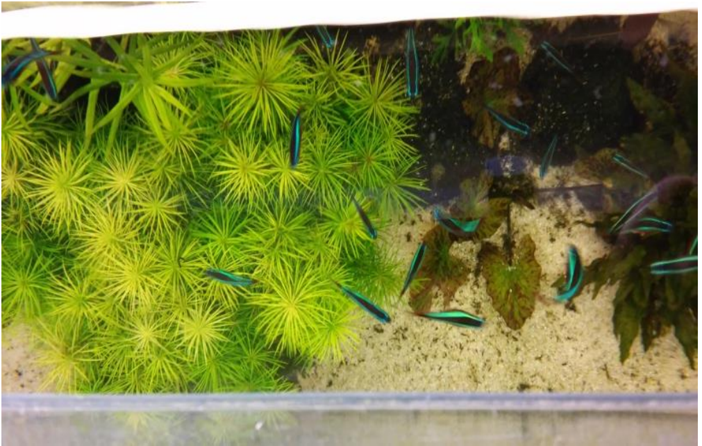
Kraakhelder zicht van boven tot op de bodem.