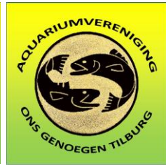
logo rond verscherpt