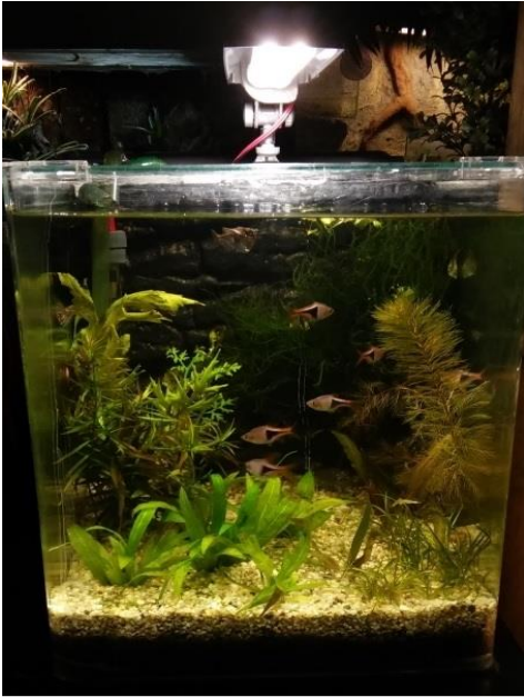
Eigen Nano in wording