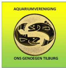
logo recht vaag